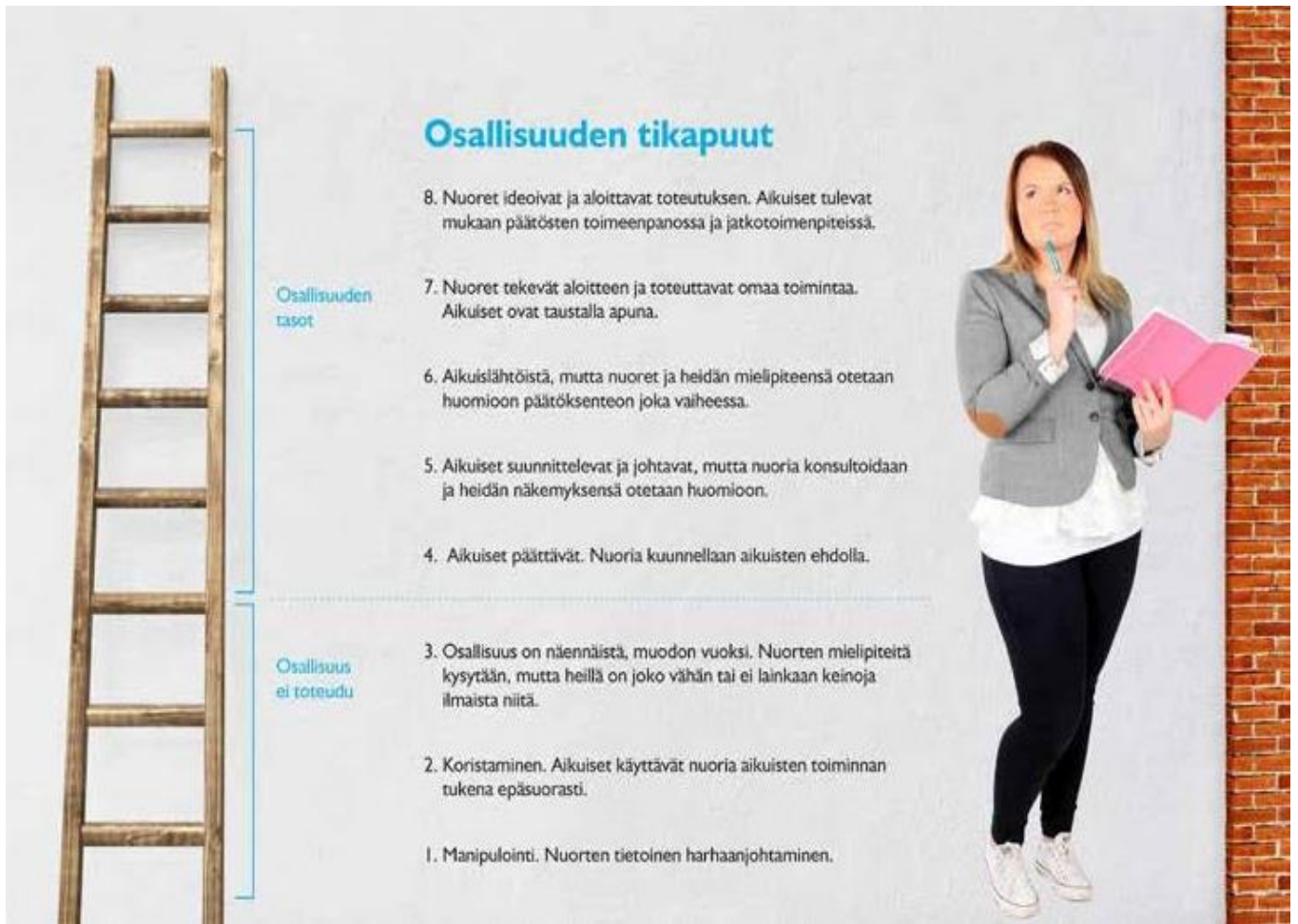
Kuvio 2. Osallisuuden tikapuut