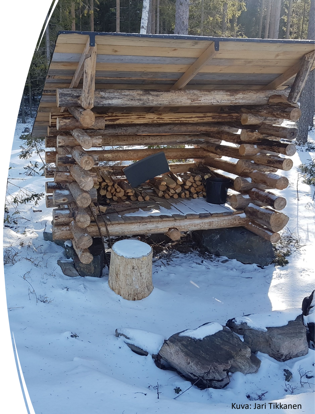
Kuva: Jari Tikkanen