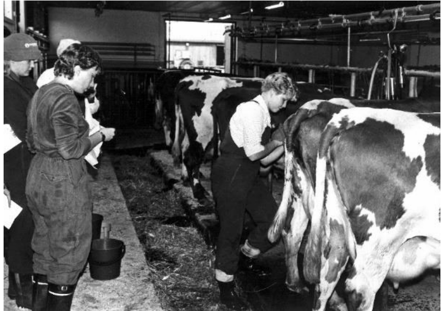
Kuvassa opiskelijoita lypsällä 1974 valmistuneessa parsinavetassa.

Ollikkalaan alun perin rakennettu navetta jäi 60 – luvun nopeassa maatalouden kehityksessä jälkeen, ja uusi parsinavetta valmistui 1974. Seuraavana siirryttiin asemalypsyyn, kun 1999 valmistui vanhan navetan jatkoksi uusi pihattonavetta. Vanha parsinavetta ja sikala saneerattiin pieneläinlaitokseksi. Toiseen päähän saatiin pieni hevostalli ja lisäksi myös metsäopetukseen omat tilat. Viimeisin navetta rakennettiin Ollikkalankadun toisella puolella olevalle pellolle. Uusi ajanmukainen tutkimus ja opetuskäyttöön suunniteltu robotinavetta otettiin käyttöön keväällä 2022.