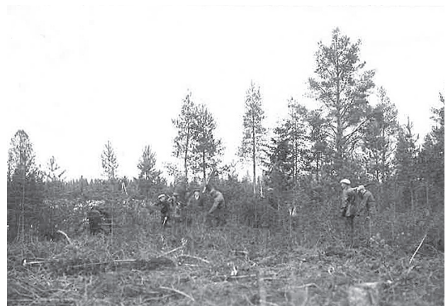
Kuva 1. Taimikon raivausta 1930-luvulla.

Kpedun Kannuksen toimipaikka on Keski-Pohjanmaan vanhin ammatillinen oppilaitos.