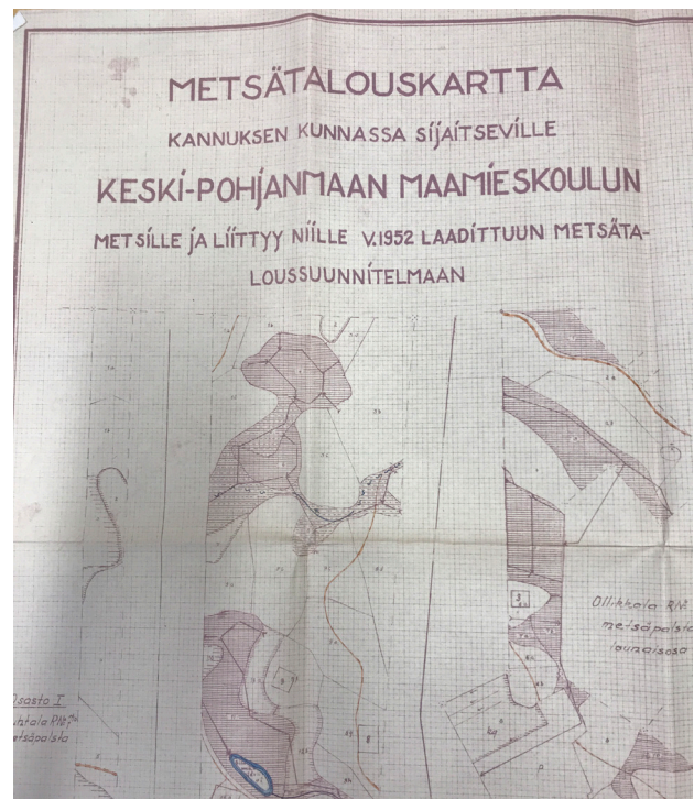
Kuva 4. Ensimmäinen säilynyt metsäsuunnitelma v. 1953..

Omat metsät ovat tärkeä osa metsäkoneenkuljettajien ja metsuri-metsäpalveluntuottajien opintoja. Metsätalouden perusteita ja puunkorjuuta on tärkeä harjoitella ensin koulun omissa metsissä. Vasta perusteiden oppimisen jälkeen voi lähteä esim. työssäoppimaan ja tekemään puunkorjuuta asiakkaiden metsissä.