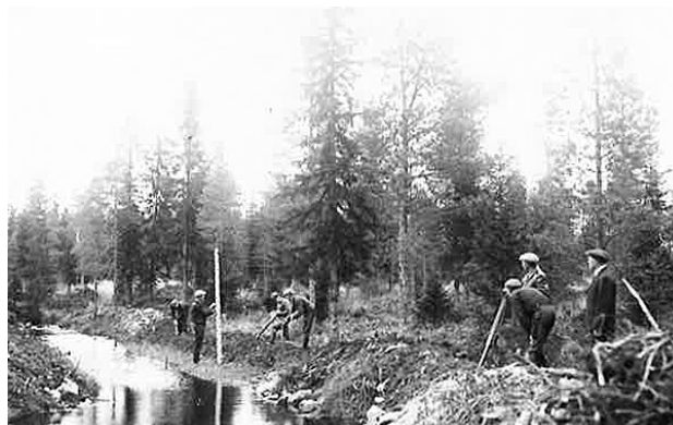
Kuva 3. Vaakituksen ja suo-ojituksen käytännön harjoituksia v. 1937.

Suunnitelmia on tehnyt mm. Piirimetsälautakunta, Metsäkeskus ja Metsänhoitoyhdistys. Nykyisin suunnitelmia tekevät myös isot metsäyhtiöt ja yksityiset metsäpalveluyritykset.