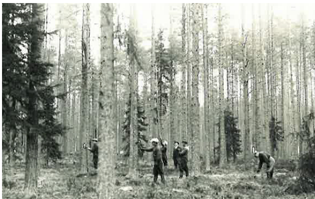
Kuva 2. Puiden leimausta 1930-luvulla.

Maamieskoulu alkoi 1930-luvulla järjestää myös erillisiä kaksi kuukautta kestäviä metsäkursseja,