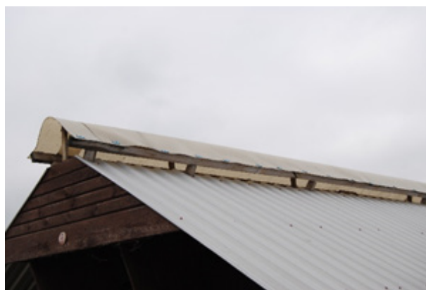
Harjaratkaisu ilmastoinnin parantamiseksi.

Toivottavasti tulevaisuudessa saadaan kehitettyä varjotaloihin ilmastointi- tai viilennysratkaisuja, joiden virtalähteenä toimisivat esimerkiksi katolle asennettavat aurinkopaneelit. Ja jos vielä saisi toivoa, niin keino olisi käänteentekevä ratkaisu varhaisen pentuolleisuuden vähentämiseksi.