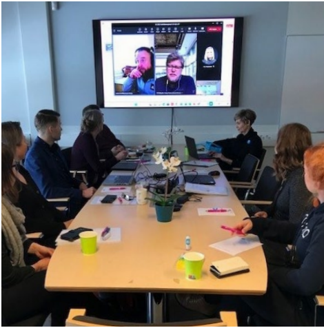
3K-kehittämissyryhmän ensimmäinen kokous 10.3.2023.