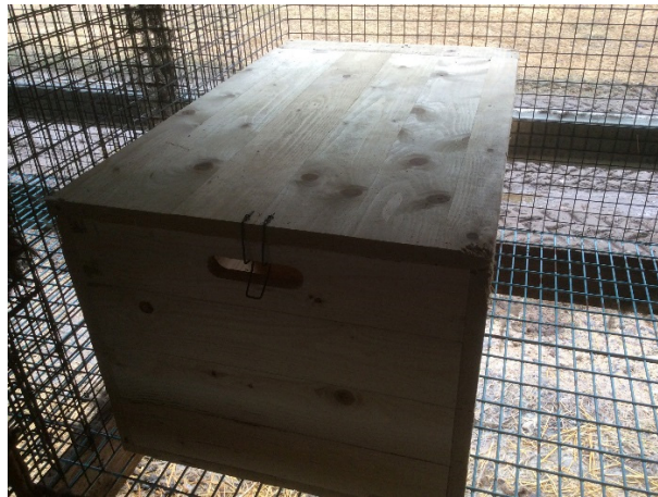
Kuvassa perinteisen mallinen pesäkoppi, jossa kantamista helpottavat aukot toimivat samalla tuuletusreikinä. Pesäkopin katto on helposti aukaistavissa ja poistettavissa.

Pesäkoppimalleja on markkinoilla ollut monenlaisia ja uudentyyppisiääkin on kehitetty. Vanha riittävän kokoinen kaksiosainen pesäkoppimalli on kuitenkin pitänyt hyvin pintansa matalalla väliseinällä varustettuna. Jos kettunaaraalta kysyttäisiin asiaa, saattaisi kysymyksen tulla lieriömäinen penikointiosa, jolloin pentuja ei ajautuisi nurkkiin niin helposti. Myös ilmanvaihto pitäisi olla kunnossa.