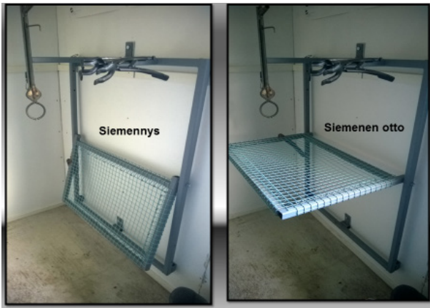
Kuvassa siemennysteline ja urospenkki samassa laitteessa. Pohja voidaan laskea tarvittaessa alas siemennystoimenpiteessä.

siemennysmäärät ovat suuria. Kallis hinta on kuitenkin rajoittanut laitteen yleistymistä tiloilla.