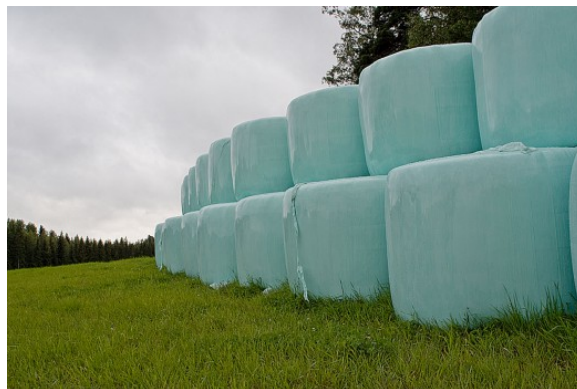
Kuva 24:

Rehuille asetettavat vaatimukset koskevat kasvien viljelyä ja sadonkorjuuta rehuksi, rehun sekoitusta ja valmistusta omaan käyttöön, myyntiin sekä vastikkeettomaan luovutukseen. Lisäksi vaatimukset koskevat elintarviketuotantoeläinten 2) ruokintaa kotoisilla ja teollisilla rehuilla. Osa vaatimuksista, esimerkiksi vaatimus rehukirjanpidosta ja rekisteröitymisestä rehualan alkutuotannon toimijaksi, ei koske elintarviketuotantoeläinten kasvatusta yksityiseen kotikäyttöön. Vaatimukset koskevat rehujen kuljetusta, varastointia ja käsittelyä tuotantopaikalla sekä alkutuotteiden kuljetusta tuotantopaikalta vastaanottajalle, esimerkiksi toiselle maatilalla tai rehutehtaaseen.