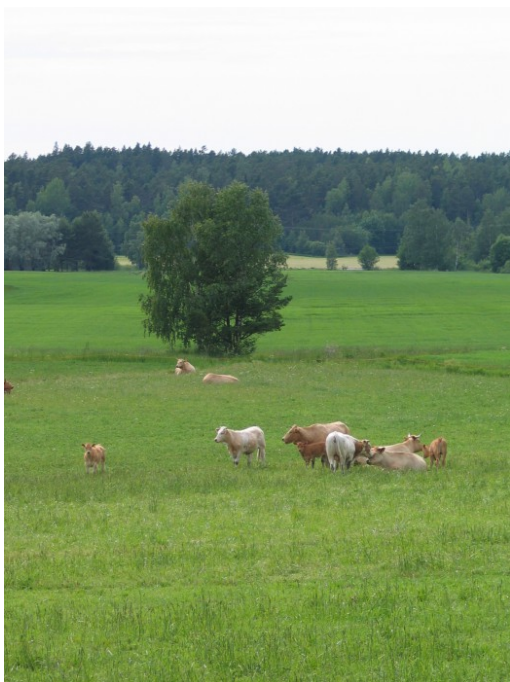
Kuva 3: