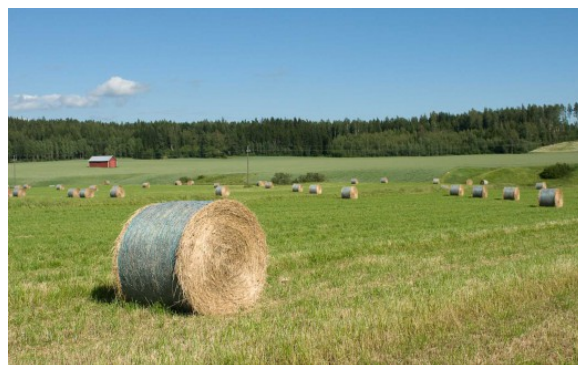
Kuva 28:

Lisätietoja entisten elintarvikkeiden rehukäytöstä 31 löytyy myös Eviran internetsivuilta.