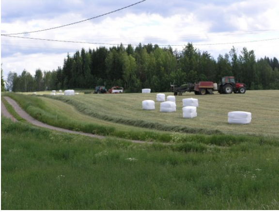
Kuva 2: