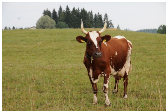
Kuva 42:

Viljelijälle lähetettävässä lopullisessa pöytäkirjassa luetellaan kaikki kyseisen vuoden tarkastuksilla havaitut laiminlyönnit. Euromääräiset tukivähennykset selviävät kunnan tekemästä tuki- tai takaisinperintäpäätöksestä. Tukileikkaus kohdistetaan maksettavaan tukeen tai se toteutetaan takaisinperintänä, jos tuet on jo ehditty maksaa. Tukipäätökseen voit hakea oikaisua ELY-keskuksesta.