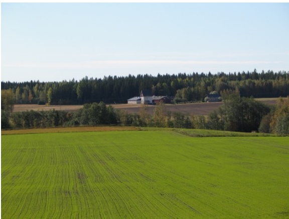
Kuva 1:

Ehtojen noudattamista valvotaan tilakäynteillä tehtävillä tarkastuksilla. Tarkastus voidaan tehdä myös esimerkiksi sellaisilla tiloilla, joilla on jonkin muun valvonnan yhteydessä havaittu täydentävien ehtojen laiminlyönti. Tarkastuksissa havaitut täydentävien ehtojen laiminlyönnit vähentävät samanaikaisesti kaikkien tukien määrää, joiden ehtona täydentävien ehtojen noudattaminen on.