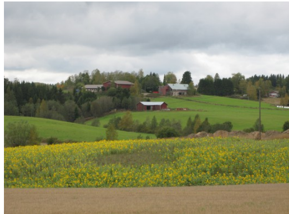
Kuva 43:

mään hyväksytyt neuvojat. Lisätietoa maatilojen neuvontajärjestelmästä ja listauksen hyväksytyistä neuvojista löydät osoitteesta www.mavi.fi .