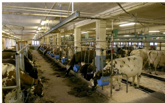
Kuva 30:

Alkutuotantopaikka on rakennettava ja hoidettava niin, ettei siellä tuotettavien ja käsiteltävien elintarvikkeiden turvallisuus vaarannu. Tuotteiden suojaamiseksi saastumiselta rehun lisäaineita, eläinlääkkeitä, kasvinsuojeluaineita, lannoitevalmisteita, biosidejä, kuten jyrsijämyrkkyyä ja desinfiointiaineita, ja muita vaarallisia kemikaaleja sekä jätteitä on käsiteltävä, varastoitava ja käytettävä oikein.