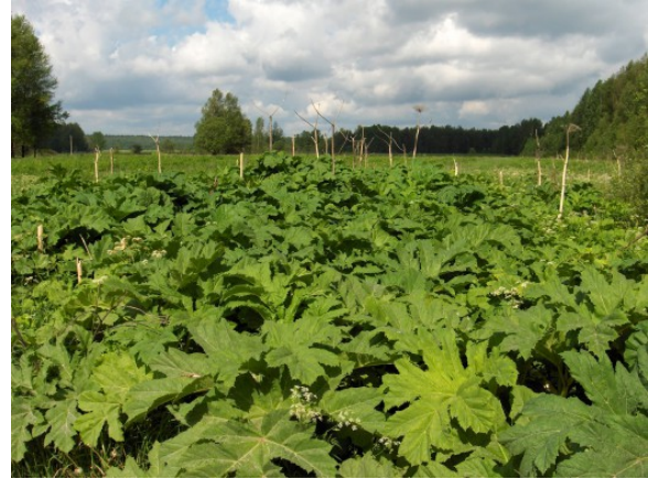
Kuva 4: Armenian jättiputki (Heracleum sosnowskyi)

Torju kaukasian-, persian- ja armenianjättiputki maatalousmaalta kemiallisesti, mekaanisesti, kitkemällä tai muilla toimenpiteillä.