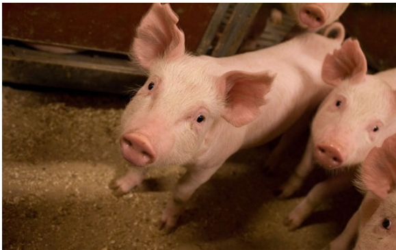
Kuva 38:

Täydentävien ehtojen eläinten hyvinvoinnin valvonta kohdistuu seuraavien tuotantoeläinten pitoon: