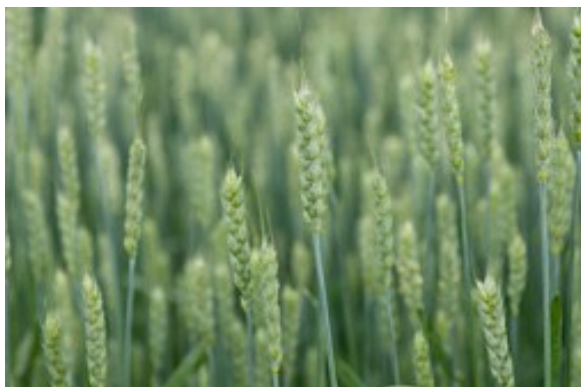
Kuva 23: