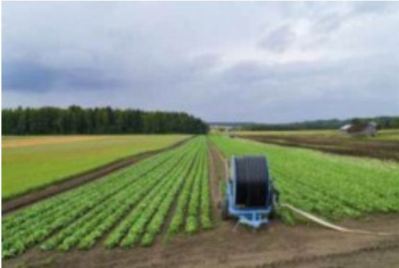
Kuva 7:

Kun käytät vettä maatalousmaan kasteluun,