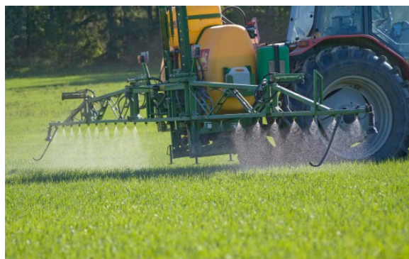
Kuva 21:

Kasvinsuojeluaineita on käytettävä asianmukaisesti ottaen huomioon hyvän kasvinsuojelukäytännön periaatteet. Kasvinsuojeluaineiden voimassaoleviin käyttöohjeisiin tulee perehtyä ja niitä on noudatettava. Kasvinsuojeluaineiden käytöstä on tehtävä muistiinpanot.