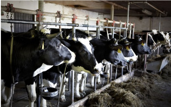
Kuva 29:

Täydentävien ehtojen elintarvikehygieniaa koskeviin vaatimuksiin on tullut joitakin muutoksia, joista useimmat koskevat maidontuotantoa.