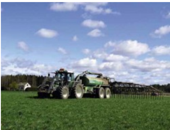
Kuva 15:

Levitä lannoitteet pellolle siten, että valumia vesiin ei tapahdu eikä pohjamaa tiivisty. Ota lannoituksessa huomioon keskimääräinen satotaso, viljelyvyöhyke, kasvinvuorotus ja maalaji. Älä levitä lannoitteita koskaan lumipeitteeseen tai routaantuneeseen eikä veden kyllästämään maahan.