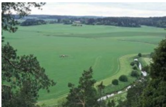
Kuva 8:

Pohjaveden kaikenlainen pilaaminen on kielletty ympäristönsuojelulain (527/2014). Ympäristölle vaarallisten ja haitallisten aineiden päästäminen suoraan tai välillisesti pohjaveteen on kielletty valtioneuvoston asetuksella 1022/2006. Ympäristölle vaaralliset ja haitalliset aineet, joita ei saa päästää suoraan tai välillisesti pohjaveteen on lueteltu taulukossa 4. Viljelijän on oman tilansa osalta huolehdittava, ettei tilan toiminnasta aiheudu edellä mainitun asetuksen (1022/2006) liitteessä E mainittujen ympäristölle vaarallisten ja haitallisten aineiden suoraa tai epäsuoraa päästöjä pohjaveteen (esim. polttoaineista, voiteluaineista, kasvinsuojeluaineista). Huomioi vaatimus kaikessa tilasi maataloustoiminnassa ja koko maatalousmaalla, myös niillä alueilla, jotka eivät sijaitse pohjavesialueella. Ympäristölle vaaralliset ja haitalliset aineet, joita ei saa päästää suoraan tai välillisesti pohjaveteen on lueteltu taulukossa 4.