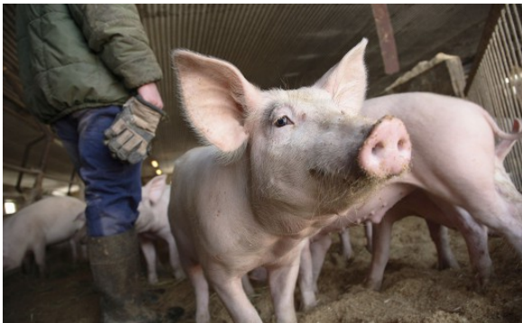
Kuva 34:

Sikojen, nautaeläinten sekä lammasta ja vuohieläinten pitäjien on