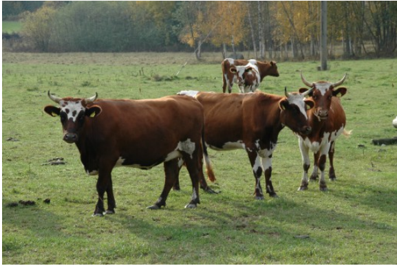
Kuva 11:

Lannan ja lannoitevalmisteiden sisältämät ravinteet voivat pilata pinta- ja pohjavesiä. Siksi lannan käytölle ja varastoinnille sekä muiden maataloudessa lannoitteina käytettävien aineiden käytölle on rajoituksia, jotka perustuvat valtioneuvoston asetukseen (1250/2014) eräiden maa- ja puutarhataloudesta peräisin olevien päästöjen rajoittamisesta. Rajoitukset koskevat kaikkia viljelijöitä.