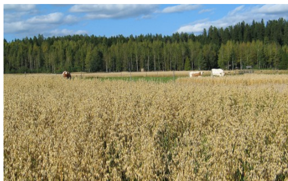
Kuva 25:

lääkerehun 3) käsittelyn ja käytön jälkeen ajoneuvot, rehun käsittely- ja ruokintalaitteistot tulee puhdistaa, jotta vältetään seuraavan rehuherän saastuminen.