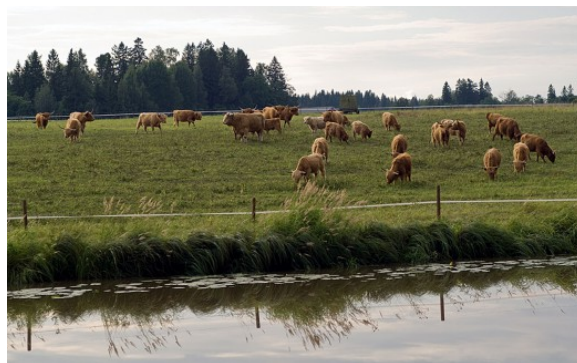
Kuva 39:

Tuotantoeläinten hyvinvointia voidaan suunnitellun otannan lisäksi tarkastaa täydentävien ehtojen osalta myös tilanteissa, joissa tilalla on todettu säädösten vastaista eläinten pitoa jonkin muun eläinsuojelutarkastuksen yhteydessä. Jos tilalla käyvä eläinsuojeluviranomainen toteaa eläinten hyvinvointiin liittyviä säädöksiä rikottavan, voidaan tarkastus laajentaa koskemaan täydentäviä ehtoja. Tällöin tilalle kohdistetaan tarkastus nimenaan täydentävien ehtojen vaatimusten osalta. Käytännössä tilalla käyvä eläinsuojeluviranomainen on yleisimmin kunnaneläinlääkäri, mutta täydentävien ehtojen laajennuksen tekee läänineläinlääkäri.