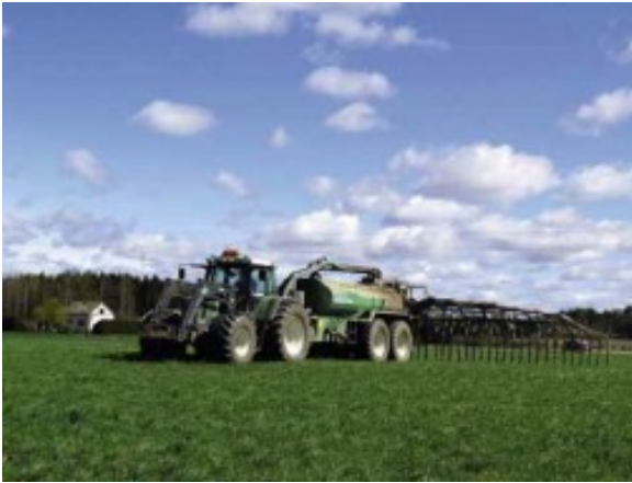
Kuva 10: