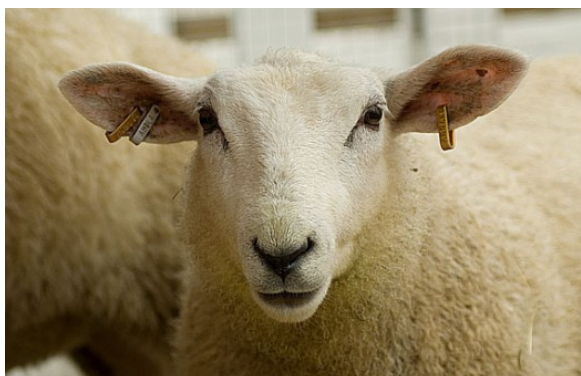
Kuva 37:

TSE eli tarttuva sienimäinen aivorappautuma (transmissible spongiform encephalopathy) on kokoomanimi usealle, eri eläinlajeilla esiintyvälle samankaltaiselle taudille. Tunnetuimmat eläimillä esiintyvät TSE -taudit ovat nautojen BSE ja lampaiden ja vuohien scrapie.