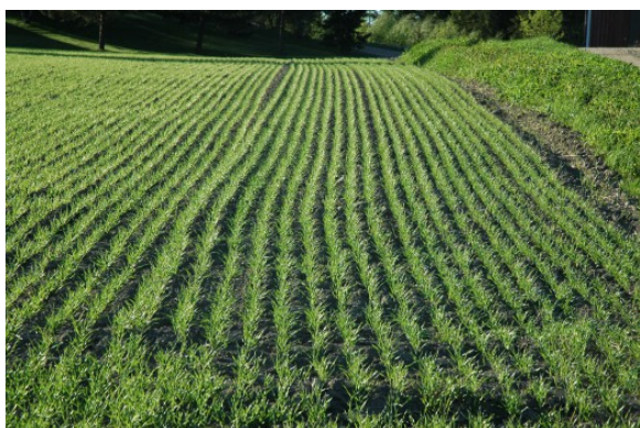
Kuva 5:

Ota paikkakunnan olosuhteet huomioon viljelyssä. Muokkaa, lannoita ja kylvä tai istuta viljelty pelto ja pysyvien kasvien ala tarkoituksenmukaisella tavalla siten, että on mahdollista saada aikaan tasainen itäminen ja kasvusto. Huolehdi kasvinsuojelusta ja estä rikkakasvien leviäminen mekaanisesti, biologisesti, kemiallisesti tai kasvinvuorotuksen avulla.