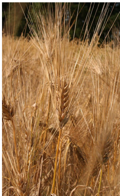
Kuva 22: