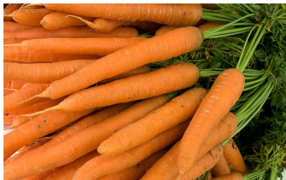
Kuva 32:

Mikäli näytteissä havaitaan määräystenvastaisia kasvinsuojeluainejäämiä, rikkomus otetaan huomioon myös täydentävien ehtojen valvonnassa.