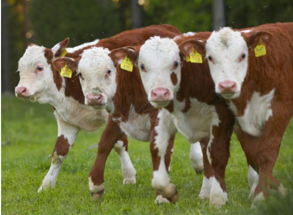
Kuva 20:

Kansanterveyteen sekä eläinten ja kasvien terveyteen liittyvät lakisääteiset hoitovaatimukset