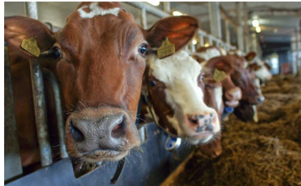
Kuva 33:

sesti tartunnan saaneet eli sairastuneen eläimen kanssa jossain vaiheessa tekemisiin joutuneet eläimet voidaan erotella muista eläimistä.